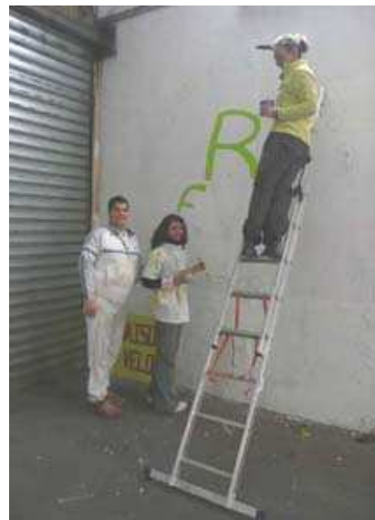
L'équipe d'UNIS-CITES au travail