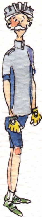
Casqué, ganté mais longiligne

Utiliser son vélo pour les petits déplacements de 2 ou 3 km, soit une dizaine de minutes, est à la portée de tous ou presque, et offre une alternative simple, rapide et agréable à l'automobile. Les bilans annuels de la Sécurité Routière montrent que les risques d'accidents à vélo en ville sont très faibles, du même ordre que les risques courus par les piétons.